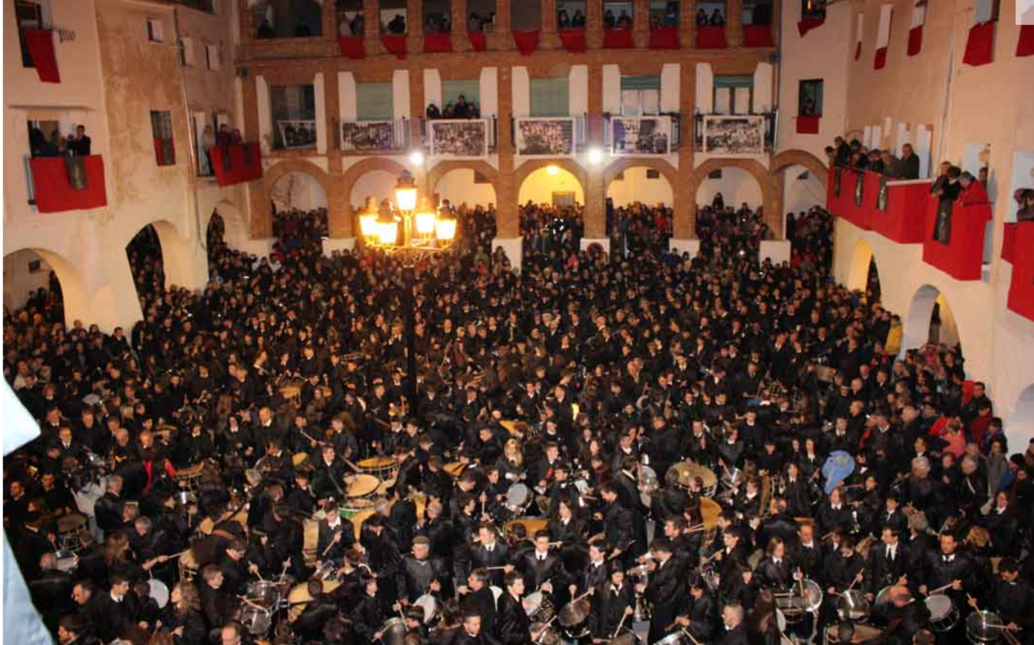
Imagen de archivo del romper la Hora en Híjar con una plaza abarrotada.

Se hace un llamamiento a los vecinos a que salgan a sus ventanas a medianoche del Jueves Santo. En la retransmisión se intercalarán las imágenes que hagan llegar hijaranos desde donde estén